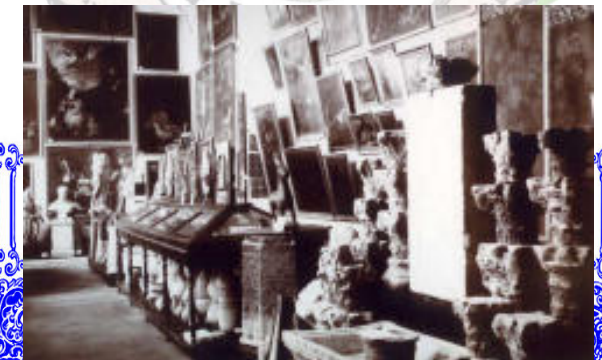
OSCURO Y MEDALLA

tras ocupar diversas sedes, se instala en 1849 en la Diputación Provincial, ubicada en el antiguo Convento dominico de San Pablo. Problemas de espacio y de falta de adecuación del mismo, hacen necesario su traslado al antiguo Hospital de la Caridad en la Plaza del Potro en 1862. Allí se instala el Museo de Pinturas y posteriormente se crea el de Antigüedades, compartiendo las salas de exposiciones hasta 1917. En 1931 se crea el Museo Julio Romero de Torres en el mismo edificio. Nos centraremos en la museología y museografía de estos centros, conocidas básicamente por escasas referencias bibliográficas y documentales y algunas fotografías de singular valor documental.